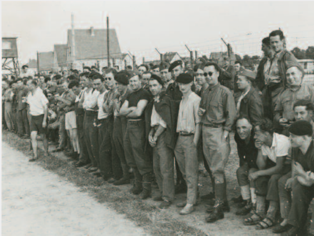
Französische Kriegsgefangene im Stalag III/D in Berlin