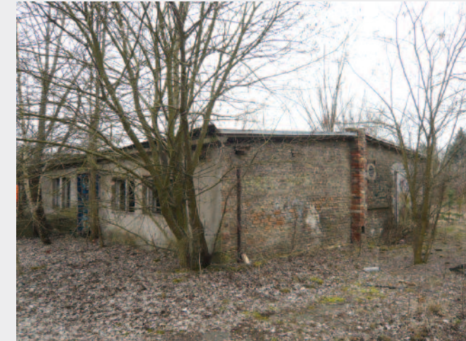
Unterkunftsbaracke 84A von 1944 vor dem Abriss im August 2012 Christina Czymay

Am 23. April 1945 befreiten sowjetische Truppen das Lager. Nach dem Ende der Kampfhandlungen sammelten sich auf dem Gelände viele ehemalige Zwangsarbeiter aus ganz Berlin vor ihrer Rück-